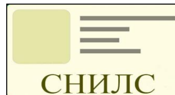
Страховое свидетельство обязательного пенсионного страхования